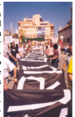
Manifestación por el río

se extendía desde Sevilla a Alcalá, y el parque de ribera que abarcaba desde el nacimiento del río hasta Alcalá siguen paralizados, la recuperación del patrimonio histórico de la cuenca representado principalmente por molinos no se está llevando a cabo, la Comisión de Seguimiento del Programa Coordinado no se reúne desde enero de 2000, las captaciones ilegales siguen proliferando... Todo indica que debemos de seguir luchando por nuestro río Guadaíra.