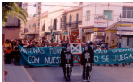
Antenas móviles fuera del casco urbano.

El pasado día 10 de mayo, tuvo lugar una mesa redonda en el Centro Cívico "Antonio Medina de Haro". Estuvieron presente los representantes de IU-CA, PP y nuestra asociación. Expusieron sus posiciones y las gestiones llevadas a cabo en relación con la instalación en Alcalá de antenas de telefonía móvil. Se comprometieron a averiguar cuales de las instalaciones carecen de los preceptivos permisos municipales. Asistieron al acto unas 35 personas.