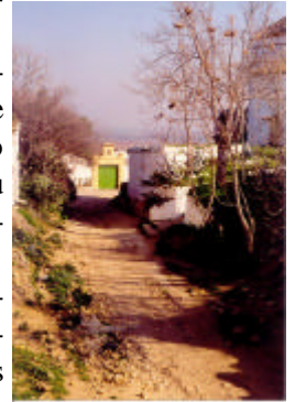
Imagen de Gandul

Igualmente creemos necesarias las inversiones para la puesta en valor de la vía verde de los Alcores a su paso por Alcalá.