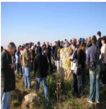
Ruta por Gandul el pasado 22 de enero.

Plantación en defensa de Gandul. Convivencia y Ruta al Toruño. Fecha: 19 de Febrero.