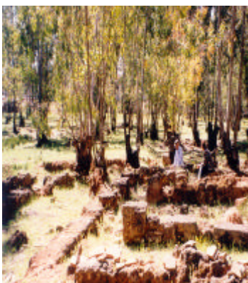
Panorámica de las ruinas romanas de "Villa Emilia".

Los vertidos en el Patarín vienen a engrasar una larga lista de vertederos incontrolados que prosperan en los cuatro puntos cardinales de nuestro pueblo.