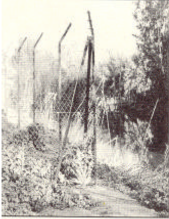
Alambrada en el cauce del río Guadaira usurpando el dominio público hidráulico.